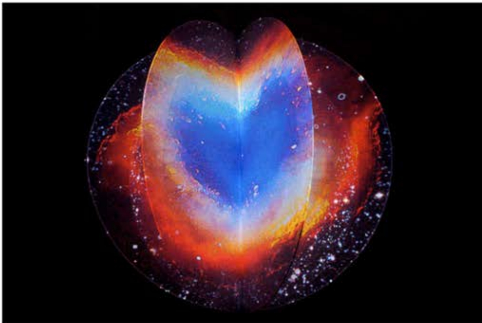
Eugènia Balcells, Vía lactea

PORTADA OPINIÓN EXPOSICIONES CONVOCATORIAS VÍDEO ZONA CRÍTICA MICROENSAYO VOCES